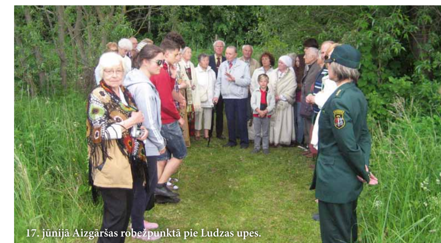
17. jūnijā Aizgāršas robežpunktā pie Ludzas upes.