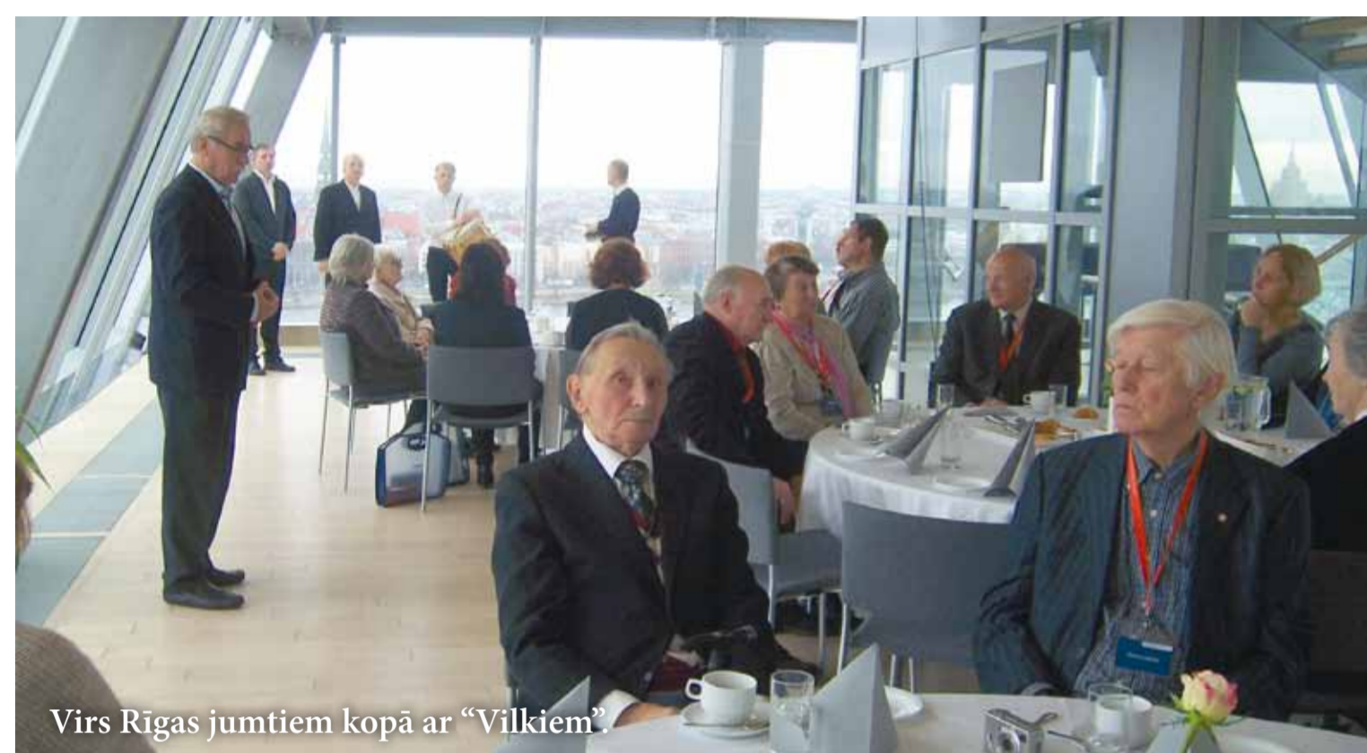
Virš Rīgas jumtiem kopā ar "Vilkiem".